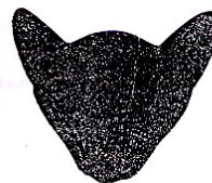
Correcte oorstand en mooi rond dome

Burmees koptype met toestemming overgenomen; copyright The Rev. Gordon Briscoe