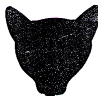
Pinch en geen dome, veel te vlakke schedel