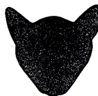
Mooi dome maar oren volgen de lijn van de kaak niet